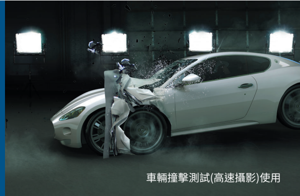
車輛撞擊測試(高速攝影)使用