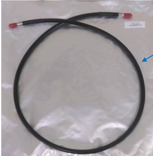
專用光導管 (1.2m /1.8m)